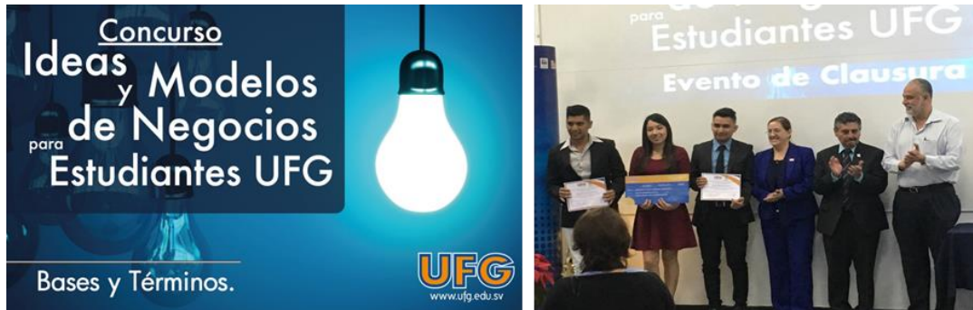
Publicación en el periódico de mayor circulación del país

» Extensiones admitidas: doc. docx pdf jpg gif txt ppt pptx xls xlsx zip rar